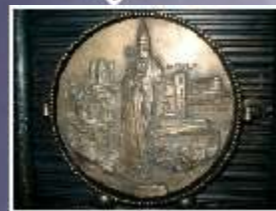
La lampada dei Comuni