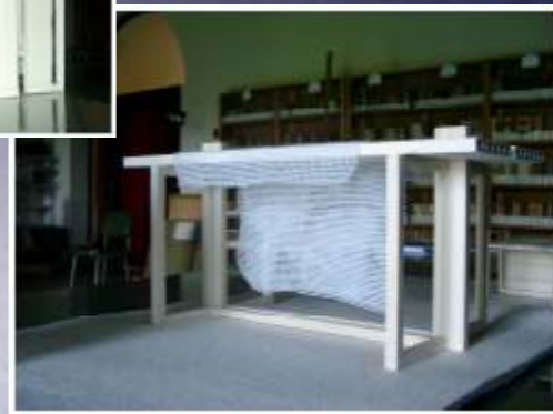
L'altare e il legg