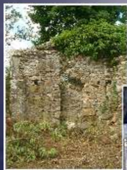
La fontana del miracolo